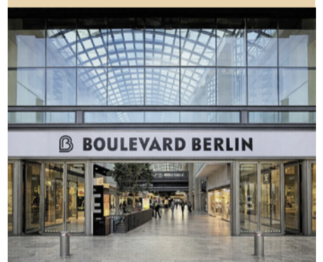
Künftig auch an Sonntagen: Durchgang vom Boulevard zur Betty-Katz-Straße

Inzwischen liegt uns eine Rückmeldung der zuständigen Stelle vor: Das Thema wurde intern geklärt. Der Durchgang zur Betty-Katz-Straße soll künftig an Sonntagen in der Zeit von 10 bis 20 Uhr gewährleistet sein. Damit soll sichergestellt werden, dass insbesondere ältere Anwohnerinnen und Anwohner den Durchgang vom Boulevard zur Betty-Katz-Straße verlässlich nutzen können – etwa nach einem Sonntagsspaziergang oder für den kurzen Heimweg.